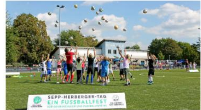
KOOPERATIONSVEREINBARUNG FÜR EINEN SEPP-HERBERGER-TAG – EIN FUßBALLFEST FÜR GRUNDSCHULEN UND FUßBALLVEREINE